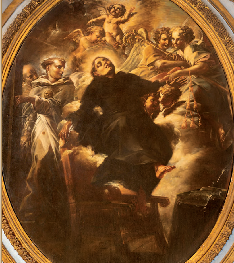
Biagio Puccini, São Boaventura em êxtase (1708). Roma, igreja de São Paulo em Regola

transformasse naquele que por excessiva caridade quis ser crucificado” (LM XIII, 3).